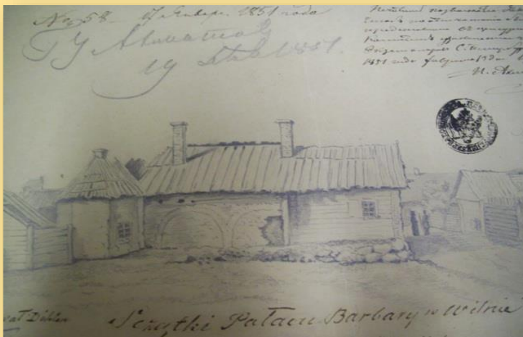
Butvilovskis. Barbaros Radvilaitės rūmų Vilniuje liekanos. Litografija. 1850 m.